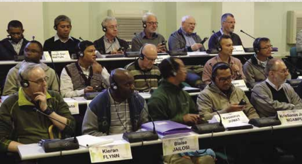
deelnemers generaal kapittel 2017