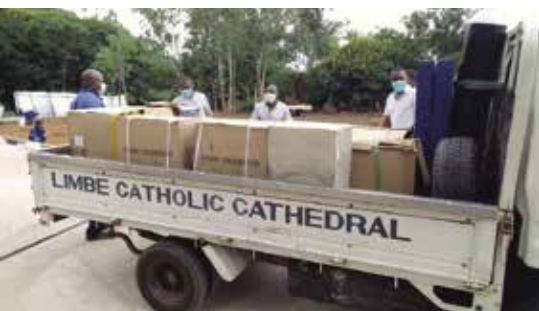
Transport medische apparatuur

De Congregatie had het zwaar te verduren het afgelopen jaar. Allereerst kwam het leven in Noord Italië geheel stil te liggen. Hier lag het episch centrum van de coronabesmettingen en de confraters in Bergamo werden dagelijks geconfronteerd met overlijdens in de stad. In vele entiteiten raakten confraters besmet en enkele overleden. Het Generaal bestuur werd gedwongen om vanuit Rome via Zoom contact te houden met de entiteiten wereldwijd. Bezoeken werden afgezegd en de lokale besturen werd gevraagd, ondanks alle beperkingen, zoveel mogelijk door te gaan.