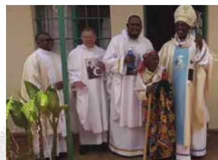
Opening Missiejaar door generaal overste (2 de van links)

Het continentale missiejaar voor Afrika en Madagaskar is een gelegenheid om samen drie belangrijke doelstellingen te verwezenlijken: het saamhorigheidsgevoel en de eenheid van de entiteiten binnen de geografische zone te versterken en deze eenheid uit te breiden tot de hele congregatie in een wereld