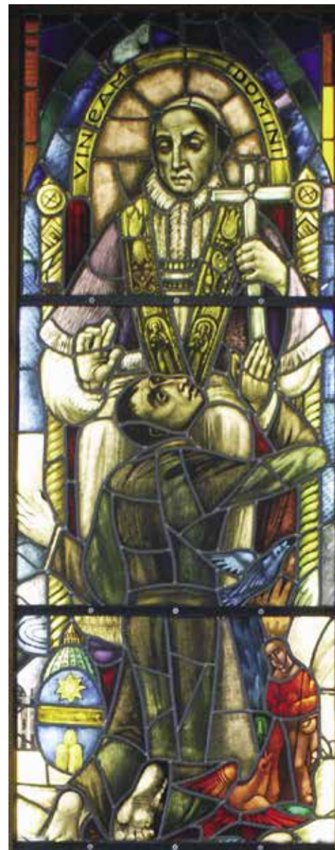
Montfort op audiëntie bij paus Clemens XI

Via de bisschop van Poitiers komt Louis-Marie in contact met een opvanghuis voor bedelaars. Montfort is zo geliefd bij de armen in het opvanghuis, dat ze hem als directeur en priester willen. Hij neemt deze uitnodiging van harte aan, maar hoopt tegelijkertijd dat het niet al te lang zal duren, zodat hij weer elders goed werk kan gaan verrichten. Montfort is enorm toegewijd in zijn roeping en gaat daarin ver. Heel ver. Op een kruis dat hij in het Gasthuis in Poitiers laat plaatsen staan de woorden: “Zichzelf verloochenen, zijn kruis dragen om Jezus Christus te volgen”. De mate waarin Montfort zichzelf wegcijfert voor een ander gaat voor de directie van het Gasthuis en de bisschop te ver en uiteindelijk wordt het Montfort verboden om er de mis te doen. Hij moet Poitiers verlaten. Maar de armen in het Gasthuis laten het daar niet bij zitten. Ze schrijven een