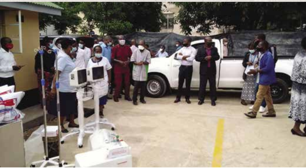
Monitoren, infausstandaards en zuurstofapparaten worden afgeleverd bij het Jozef-ziekenhuis in Nguludi

konden 3 missieziekenhuizen voorzien worden van intensive care plaatsen. Zuurstofapparaten, ziekenhuisbedden, monitoren en veel andere noodzakelijke apparatuur en hulpmiddelen, kon Aartsbisschop Msusa met hulp vanuit Nederland aanschaffen en verdelen onder de ziekenhuizen. Niet alle nood is hiermee opgelost, maar er is een duidelijk signaal afgegeven aan overheden en hulporganisaties dat armere landen, waaronder Malawi, niet aan de aandacht mogen ontsnappen en de hulp dienen te krijgen die ze nodig hebben.