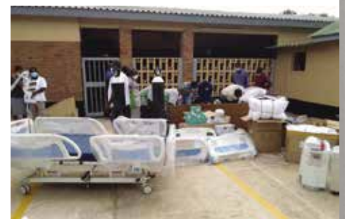
Bedden afgeleverd bij het Montfort-ziekenhuis in Nchalo

Ondanks alle beperkingen hebben de Nederlandse montfortanen invulling kunnen geven aan hun montfortaanse levensstijl en visie: van betekenis zijn voor de minder bedeelde medemens. ■