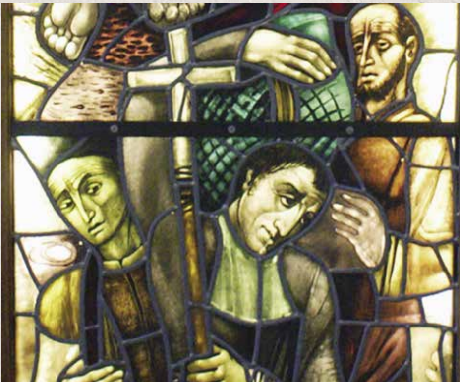
Montfort op missie

voorgoed afscheid te nemen van het Gasthuis in Poitiers.