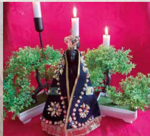
beeldje van O.L.V van Brazilië