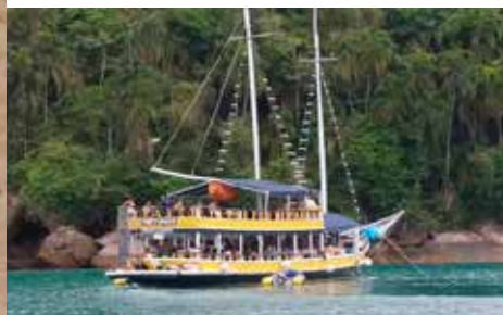
boottocht op de oceaan