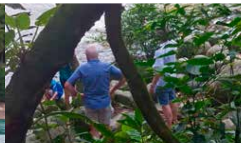
op weg naar de waterval