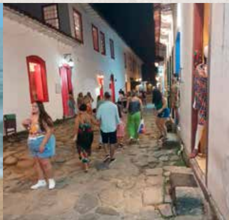
Paraty in de avond