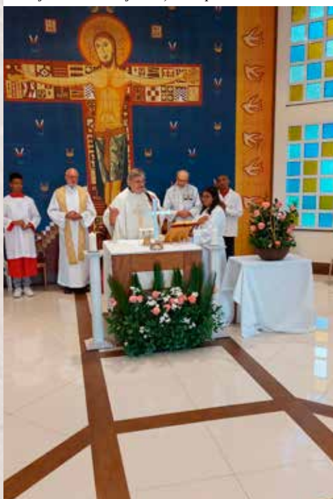
Viering 30 jaar Sitio Agar in Montfortkapel