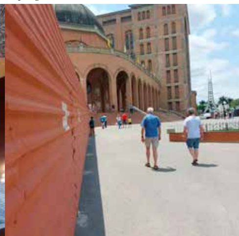
O.L.V van Brazilië