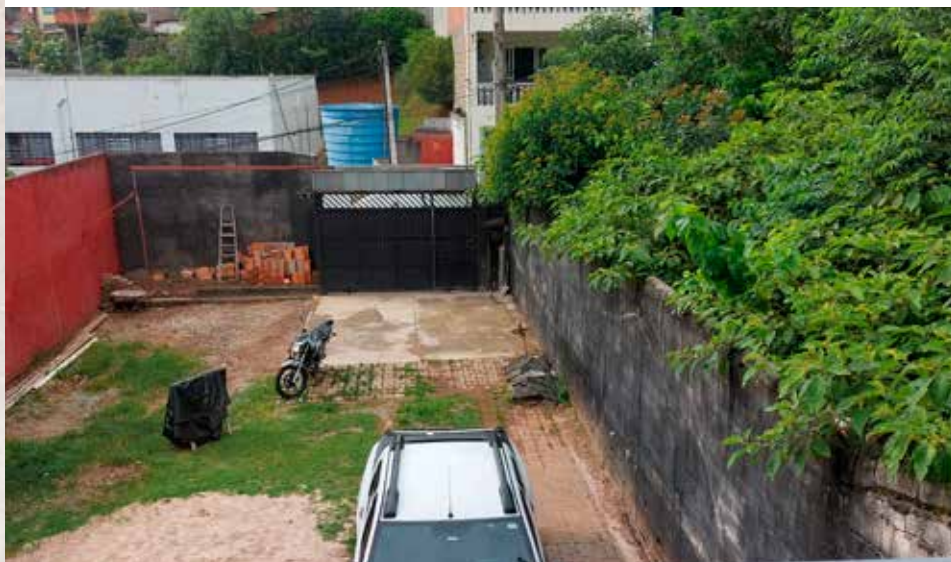
bij Antoon van Noije thuis, binnenplaats'