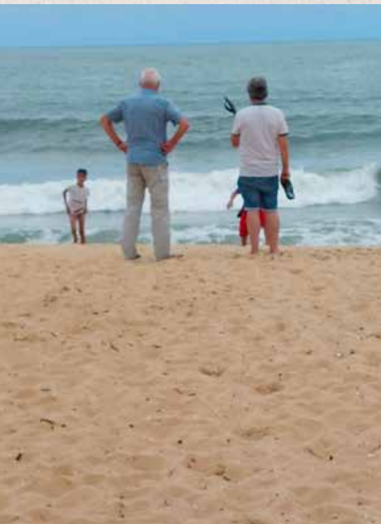
aan het strand