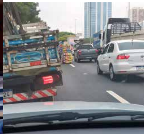
in de file op weg naar het vliegveld