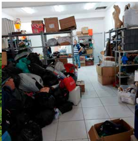
ongesorteerde voorraad voor de bazaar