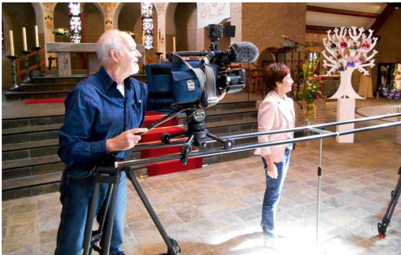
aan het werk in de St. Hubertuskerk in Genhout